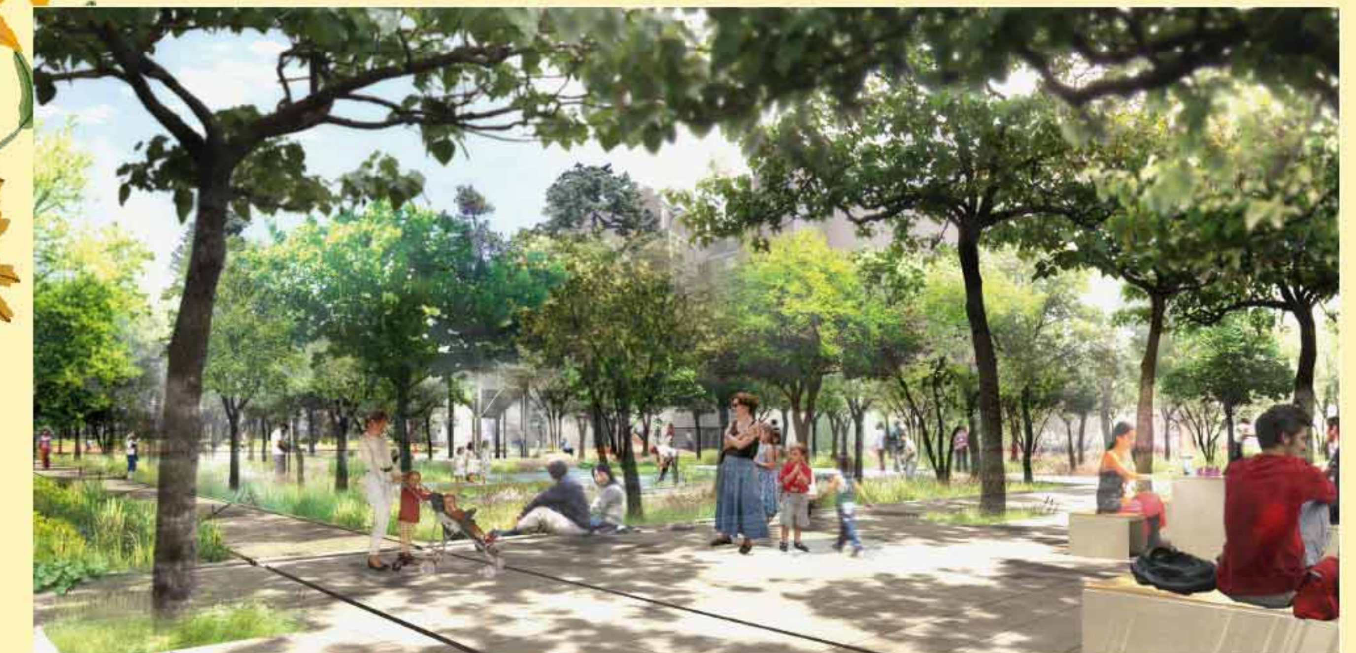
Dessin d'ambiance, vue depuis l'entrée par la rue des Cailloux