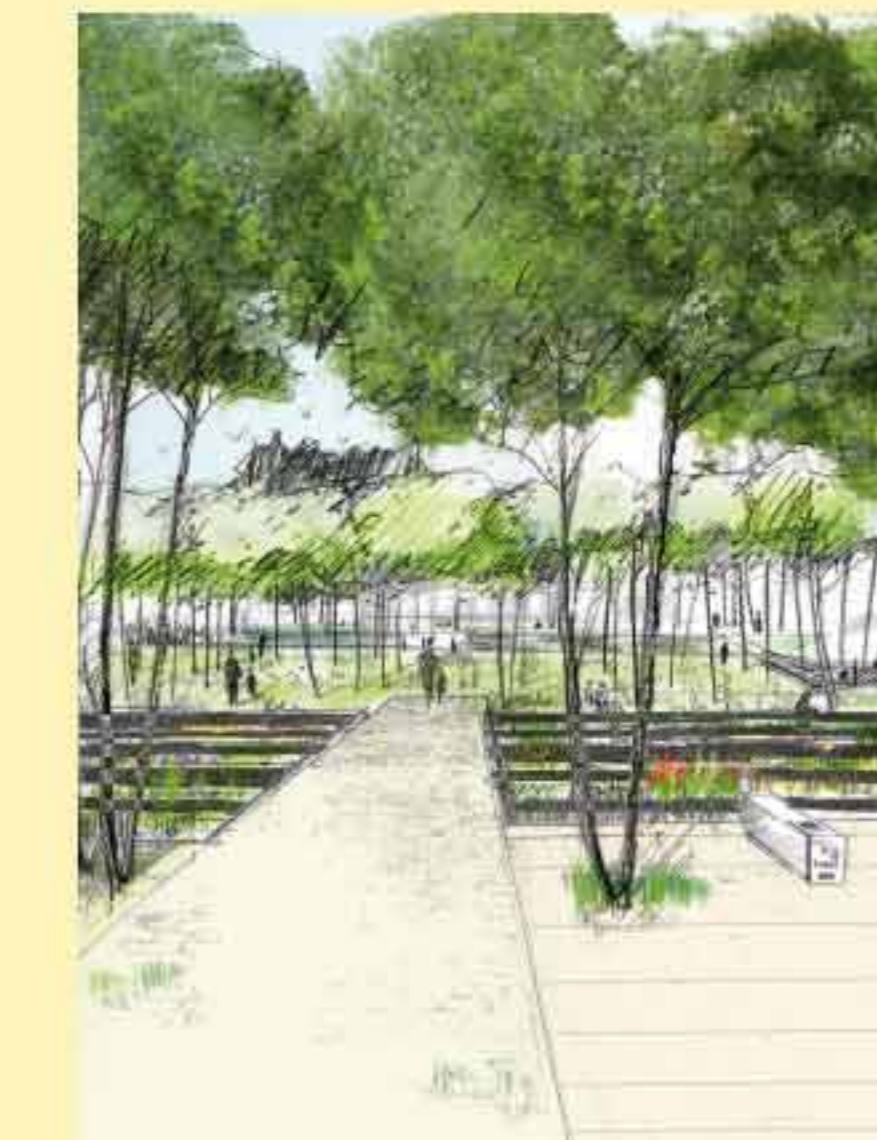
Le jardin des quatre couleurs, jardin pédagogique