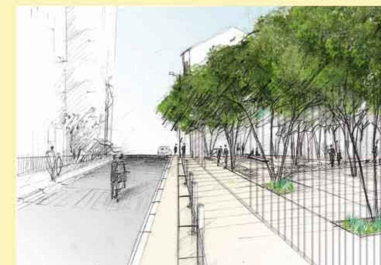
Facade rue des Cailloux